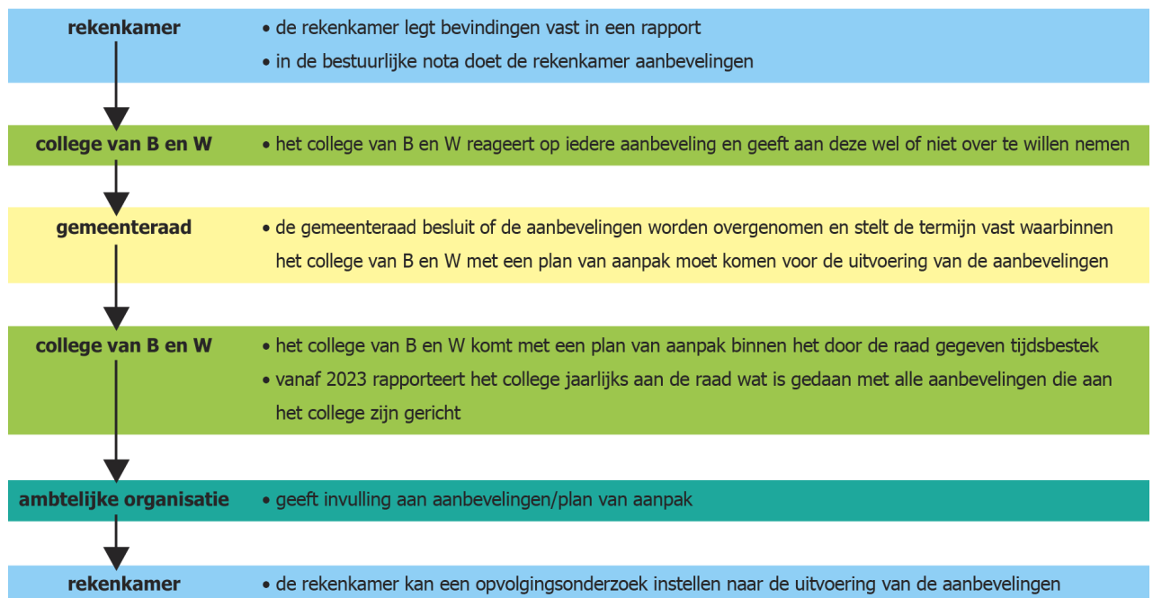
figuur 2-1: processtappen van rapport naar opvolging

De eerste afspraak is dat de rekenkamer het college de mogelijkheid geeft tot een reactie op de conclusie en aanbevelingen van het onderzoek. Deze bestuurlijke reactie neemt de rekenkamer integraal over in het rapport. In deze reactie geeft het college per