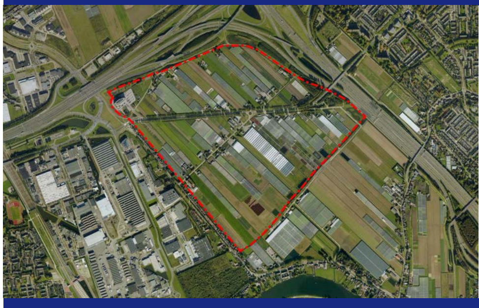
Figuur 1-1 Plattegrond Nieuw Reijerwaard

De ontwikkeling van Nieuw Reijerwaard was een gezamenlijk initiatief van de rijksoverheid, de provincie Zuid-Holland en de gemeenten Ridderkerk, Rotterdam en Barendrecht. De mate van betrokkenheid van deze partijen bij de daadwerkelijke realisatie van het bedrijventerrein verschilt echter. De rijksoverheid en provincie leveren financiële bijdragen aan de realisatie – en groene inpassing – van het bedrijventerrein. Ook waren zij betrokken bij de keuze van de locatie, de infrastructuur en de planologische besluitvorming. De rijksoverheid en provincie participeren echter niet in de gemeenschappelijke regeling Nieuw Reijerwaard (GR). 2 Dit openbaar lichaam is opgericht op 1 januari 2012 en heeft als doel om het bedrijventerrein te ontwikkelen door onder meer het verwerven en beheren van gronden en het voeren van een grondexploitatie (GREX). 3