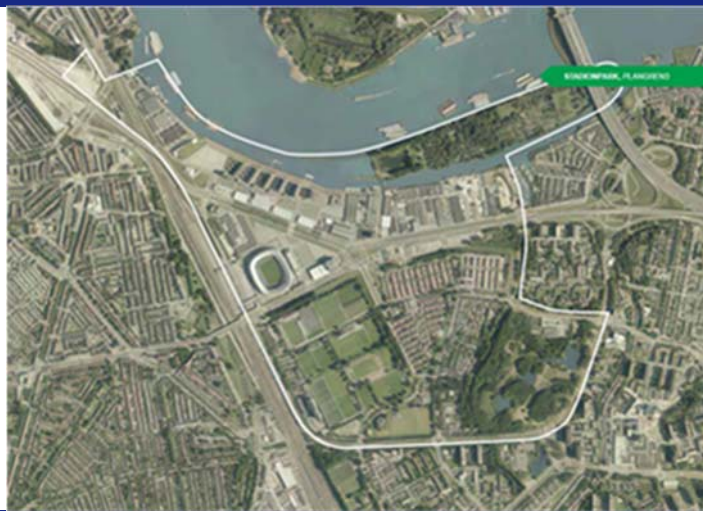
figuur 2-1 plangebied Stadionpark

Feyenoord City maakt onderdeel uit van de gebiedsontwikkeling Stadionpark. Stadionpark bestaat uit een groter gebied waarbij naast Feyenoord City ook wordt ingezet op een kwaliteitsimpuls van de gebieden Sportcampus, Park de Twee Heuvels, bedrijvenpark Stadionweg en het Eiland van Brienenoord. De ontwikkeling is vastgelegd in de gebiedsvisie Stadionpark. 6 In de onderstaande figuur is het plangebied Stadionpark weergegeven.