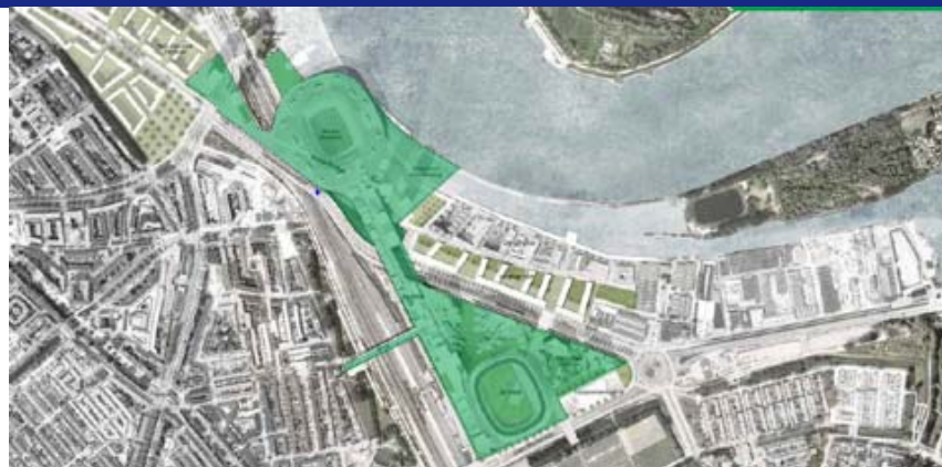
figuur 2-2 plangrens Feyenoord City

Binnen deze bredere gebiedsontwikkeling neemt het project Feyenoord City een prominente plaats in. Dit is het gearceerde deel in de onderstaande figuur.