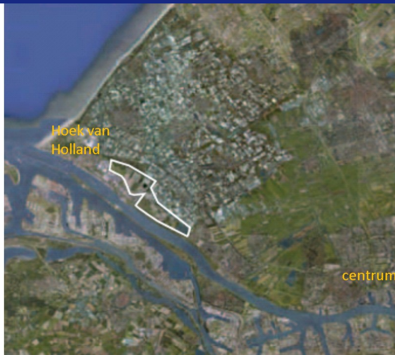
figuur 1-1: ligging Bonnenpolder en Oranjevuitenpolder

Het rijk, provincies en gemeenten kunnen beleid voeren om bepaalde nieuwe ontwikkelingen in deze gebieden te stimuleren of juist tegen te houden. Ten aanzien van de Bonnenpolder en de Oranjevuitenpolder is er veel discussie geweest over de manier waarop de overheid zou moeten ingrijpen en er zijn verschillende plannen opgesteld.